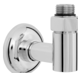
Набор комплектующих для ПС G 1/2" НР x G 1/2" НР арт. 03003-1212