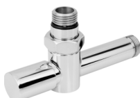
Вентиль запорный (круглый) G 1/2" НР x 1/2" НР арт. 01000-1212