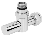
Вентиль запорный (круглый) G 1/2" НР x 3/4" НГ арт. 01000-1234