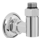
Набор комплектующих для ПС G 1/2" НР x G 3/4" НГ арт. 03002-1234