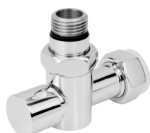
Вентиль запорный (скрытый) G 1/2" НР x 3/4" НГ арт. 01001-1234