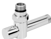
Вентиль запорный (скрытый) G 1/2" НР x 1/2" НР арт. 01001-1212