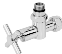
Вентиль запорный (крестовой) G 1/2" НР x 3/4" НГ арт. 01002-1234