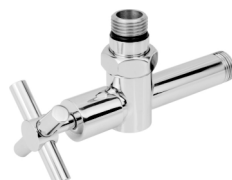
Вентиль запорный (крестовой) G 1/2" НР x 1/2" НР арт. 01002-1212