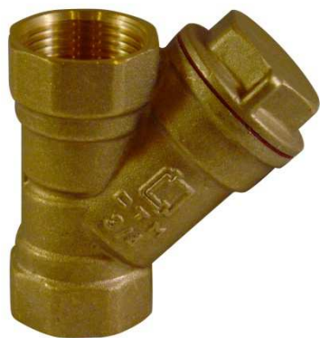
Фильтр сетчатый СТМ (механической очистки)

Изготовитель: «Sanitary Technic Machinery Co., Ltd», 138, West Zhongshan road, Haishu, Ningbo, Китай.