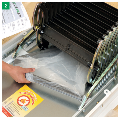
2 kontrola dodaného typu a rozměru stahovacích schodů