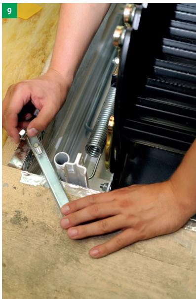
9 třetí osoba, která je již v půdním prostoru pomocí 4 ks nosníků upevní rám