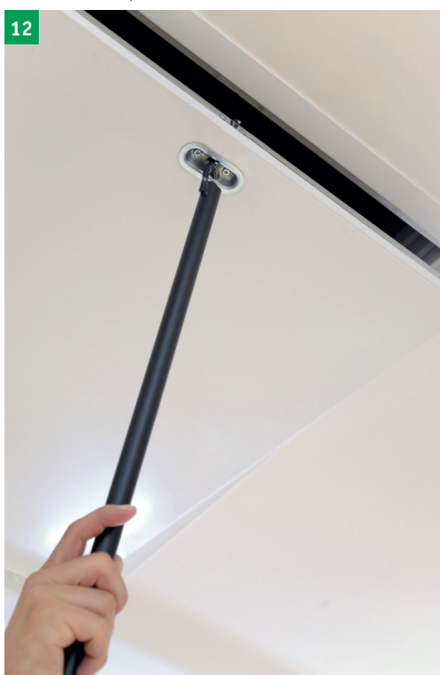
12 nasazení stahovací tyče a otevření víka