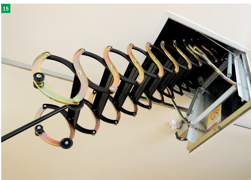
15 složení schodů pomocí stahovací tyče