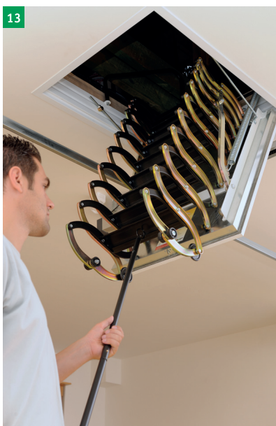
13 stažení schodů pomocí stahovací tyče