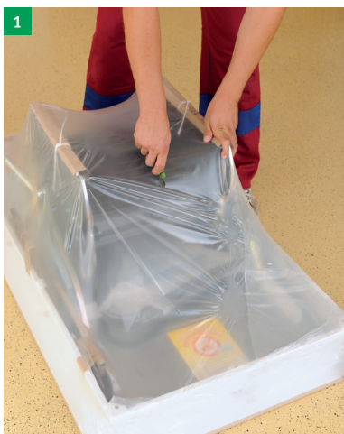
1 rozbalení stahovacích schodů