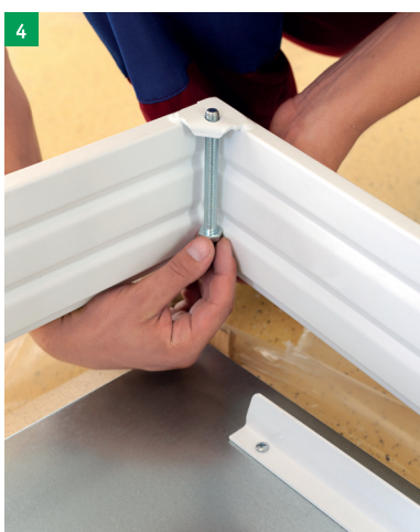
4 nasazení 4 kotevnicích šroubů