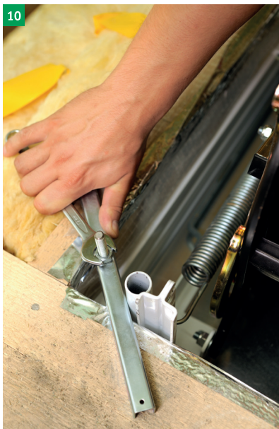
10 řádné utažení 4 ks kotevních šroubů