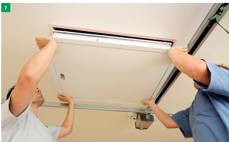
7 vsazení schodů do stavebního otvoru