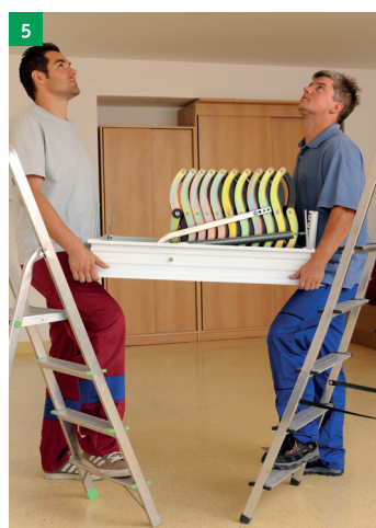
5 dvě osoby vyzvednou schody do stavebního otvoru