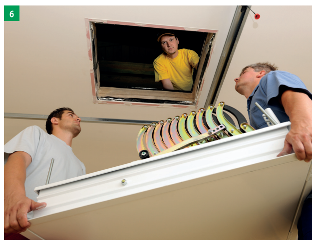
6 dvě osoby vyzvednou schody do stavebního otvoru