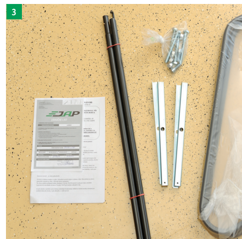
3 přečtěte si návod a zkontrolujte úplnost dodávky