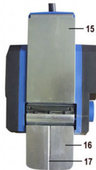
Вид рубанка снизу